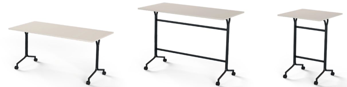
Rechthoekige tafel Rechthoekige statafel Vierkante statafel