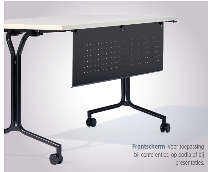
Frontscherm voor toepassing bij conferenties, op podia of bij presentaties.