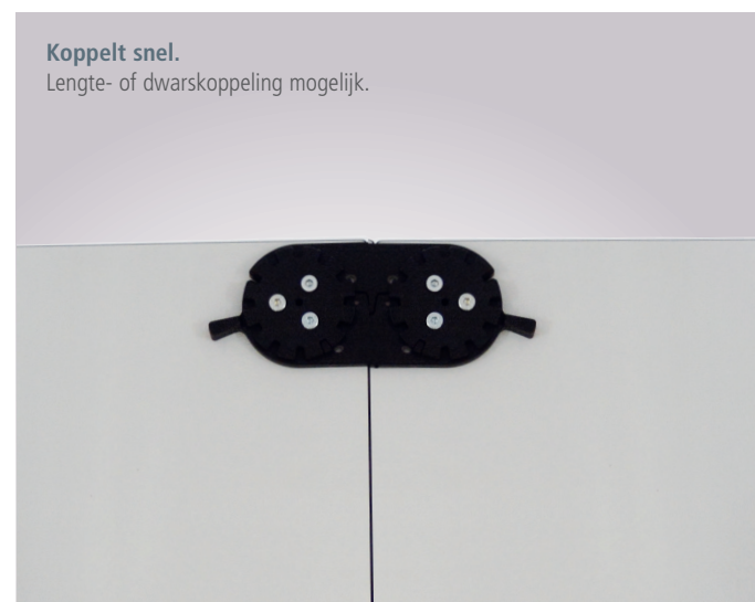
Koppelt snel. Lengte- of dwarskoppeling mogelijk.