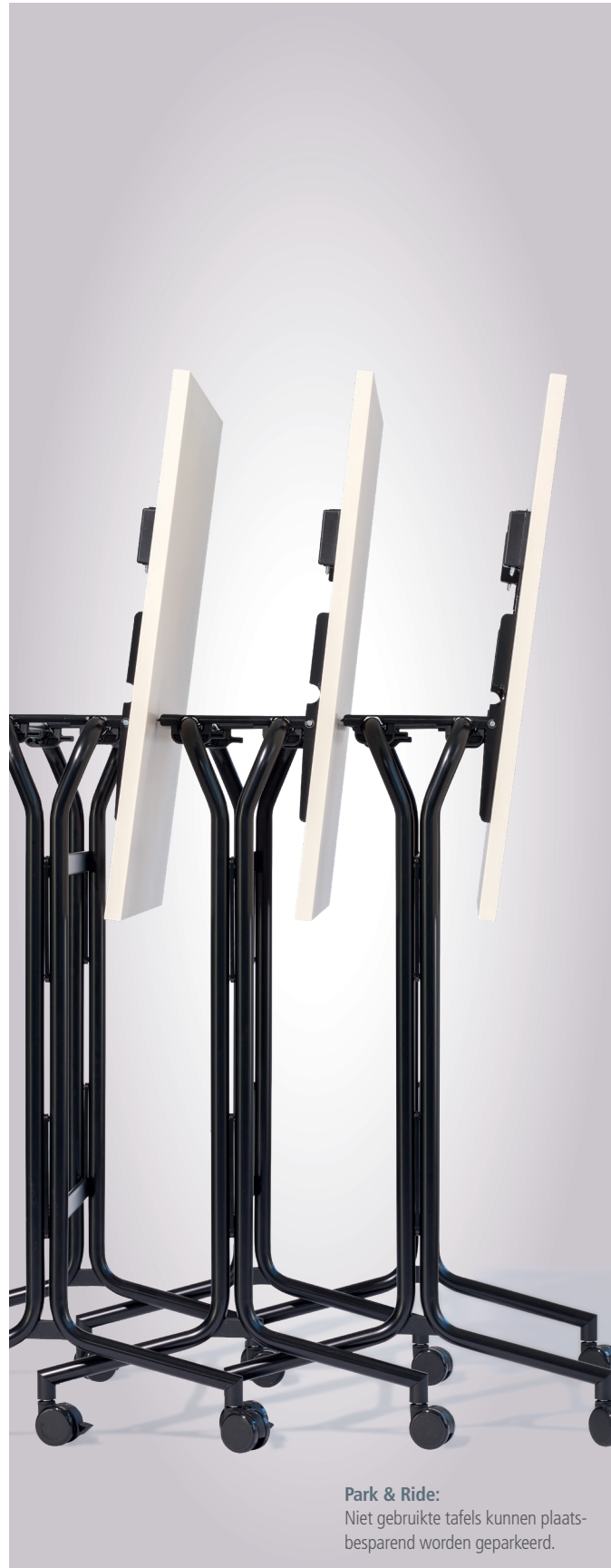
Park & Ride: Niet gebruikte tafels kunnen plaatsbesparend worden geparkeerd.