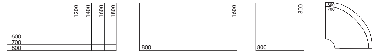
Rechthoekige tafel Rechthoekige statafel Vierkante statafel Hoek inhangblad