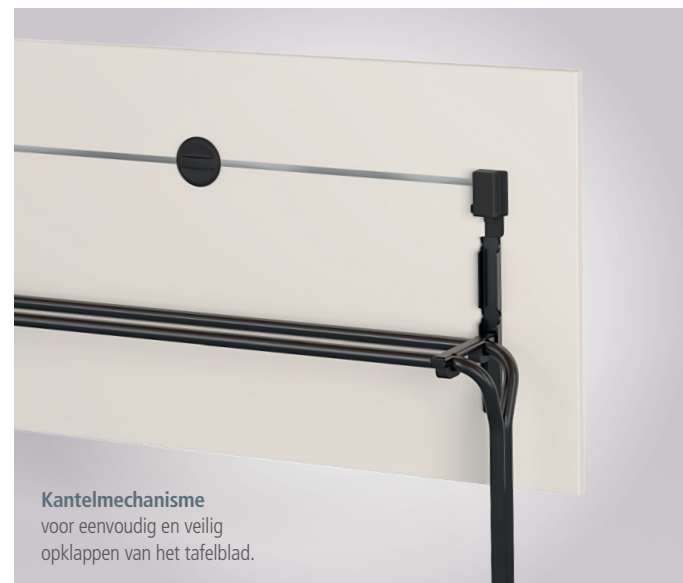
Kantelmechanisme voor eenvoudig en veilig opklappen van het tafelblad.