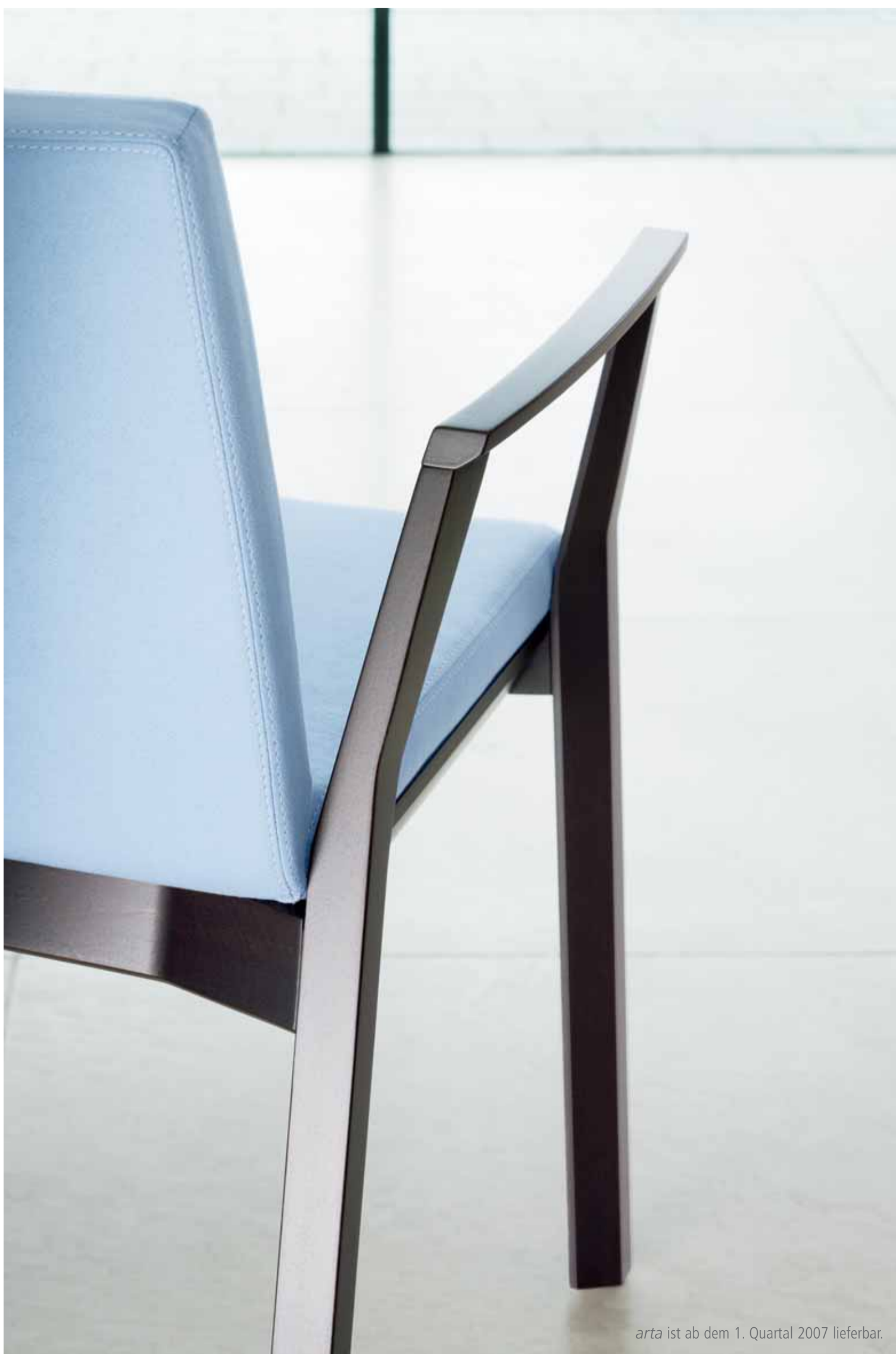
arta ist ab dem 1. Quartal 2007 lieferbar.

Wiesner-Hager präsentiert neue Holzstuhlfamilie arta