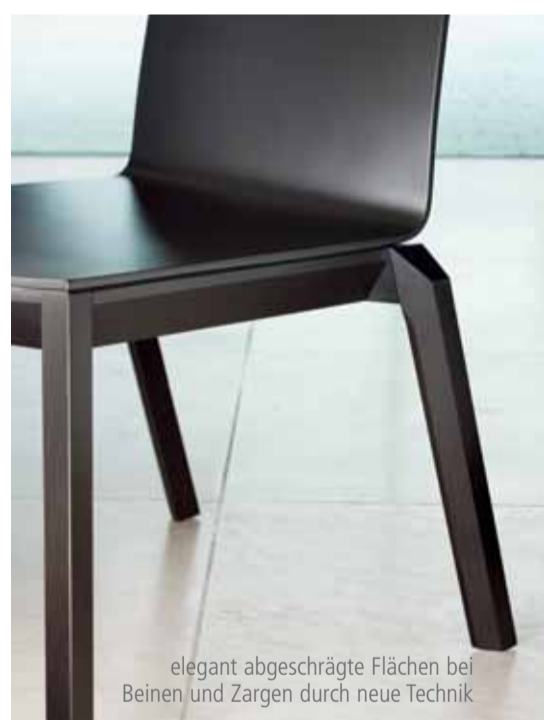
elegant abgeschrägte Flächen bei Beinen und Zargen durch neue Technik