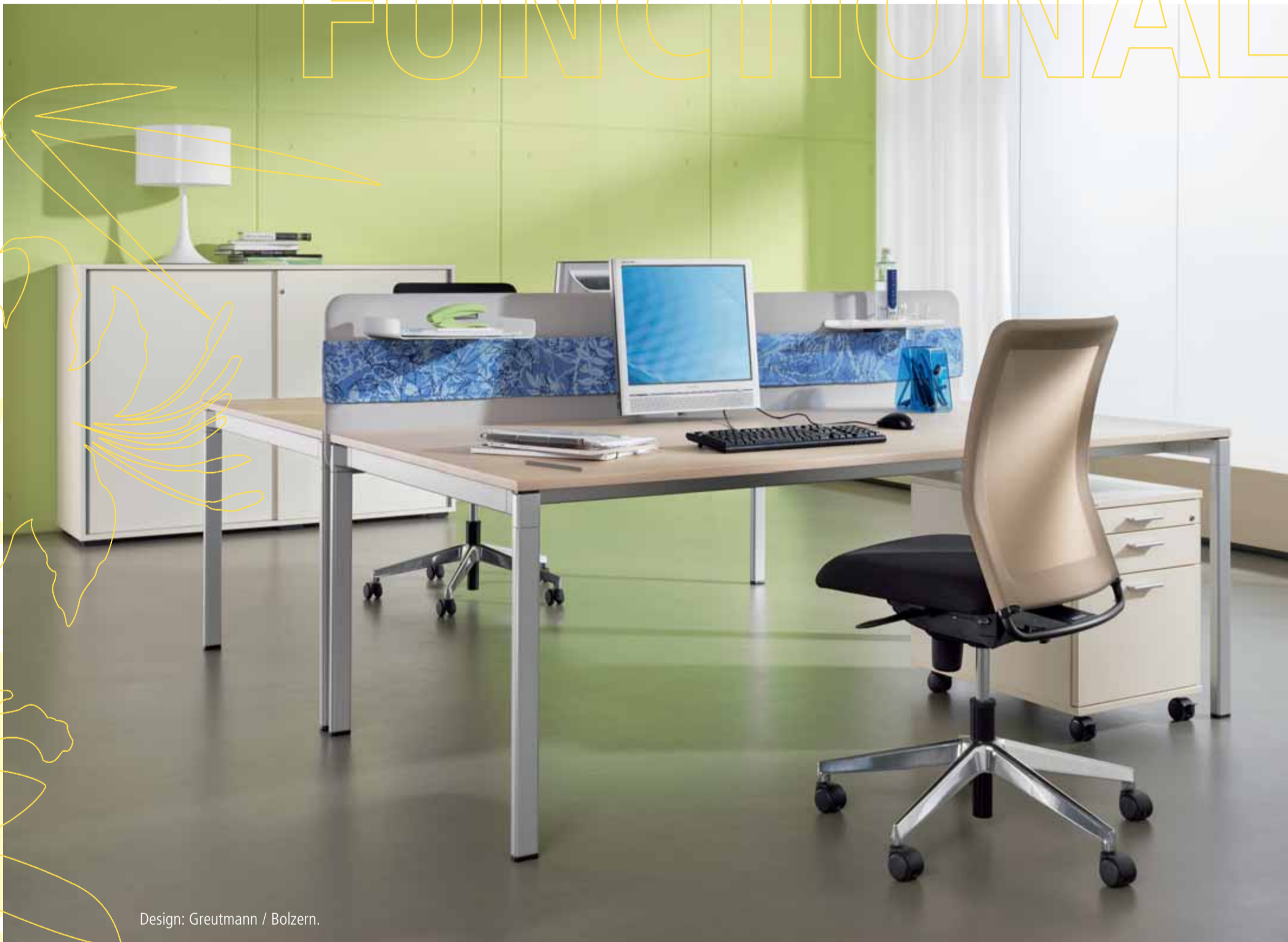
Design: Greutmann / Bolzern.

Unterschiedliche Aufgaben stellen unterschiedliche Anforderungen an ihren Arbeitsplatz. veron ist darauf ausgerichtet, diese Vielzahl von Tätigkeitsfeldern aufzugreifen und umzusetzen. Je nach • Stand der Informations- und Kommunikationstechnologie des Unternehmens, • Intensität der Hardwarenutzung und Kabelbedarf sowie • Aufgabenstellung des einzelnen Mitarbeiters (von extrem mobil bis hin zu fixen Backoffice Mitarbeitern)