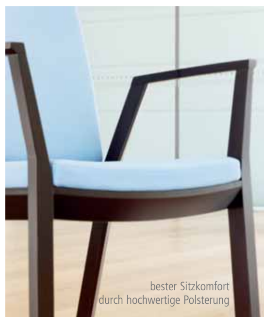
bester Sitzkomfort durch hochwertige Polsterung

Natürlichkeit, Wärme, Wohnlichkeit – Emotion und innovative Technologie