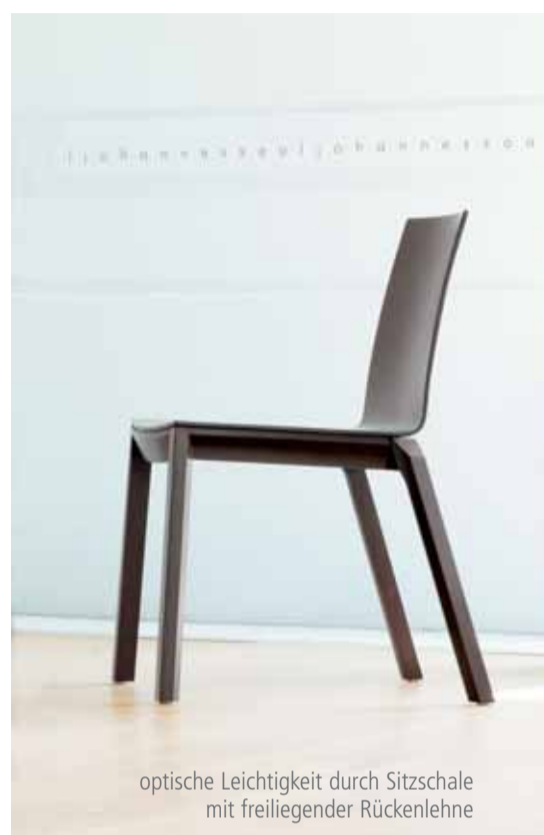
optische Leichtigkeit durch Sitzschale mit freiliegender Rückenlehne