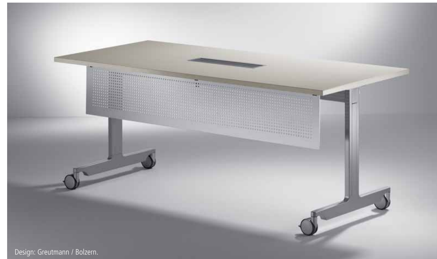
Design: Greutmann / Bolzern.

Vorübergehend nicht benötigte Tische können platzsparend "geparkt" werden. Der Gasfeder-Klappmechanismus sorgt für eine weiche, schonende Schwenkbewegung der Platte. Außerdem können durch den