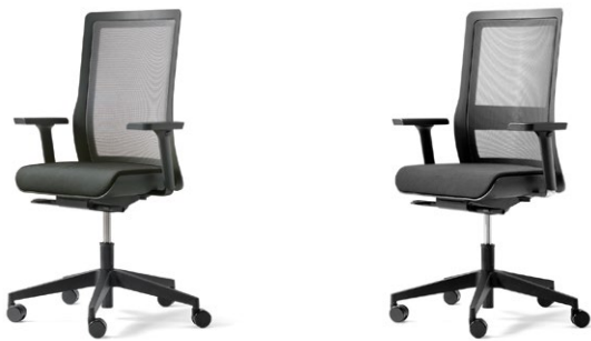
Drehstuhl mit Armlehne höhenverstellbar 5431-101A zerlegt*