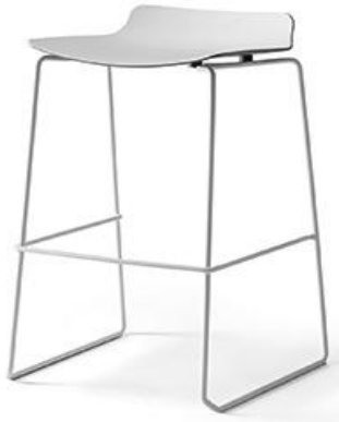
Design: neunzig° design