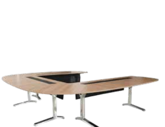
pulse table de conférence

A-4950 Altheim Linzer Strasse 22 T +43 (7723) 460-0 altheim@wiesner-hager.com