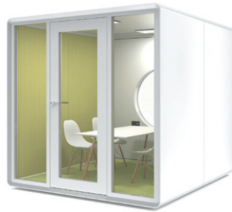
steve meeting pod