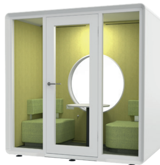
mike creative spot

A-4950 Altheim Linzer Strasse 22 T +43 (7723) 460-0 altheim@wiesner-hager.com