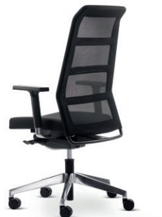
paro_2 siège de bureau

A-4950 Altheim Linzer Strasse 22 T +43 (7723) 460-0 altheim@wiesner-hager.com