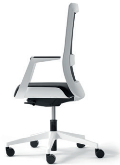
poi siège de bureau