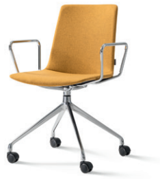
nooi siège de conférence