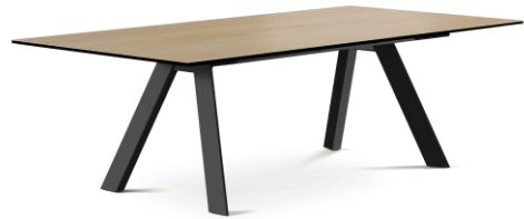
Rechteck-Tisch 1-fach Füße Metall