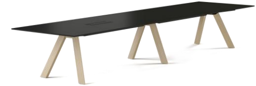
Rechteck-Tisch 2-fach Füße Holz