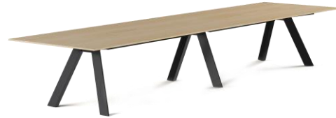
Rechteck-Tisch 2-fach Füße Metall