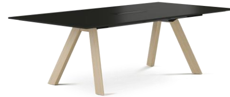
Rechteck-Tisch 1-fach Füße Holz